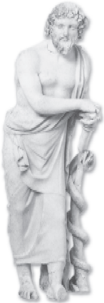
Äskulap (Asklepios) lehnt sich auf eine Stütze, um die sich eine Schlange ringelt – der Äskulapstab (Rhodos, 3. Jhd. v. Chr.).